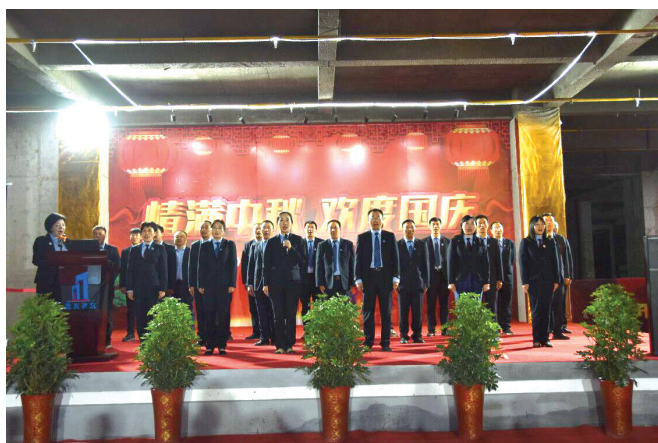
合唱司歌《梦翔蓝天》