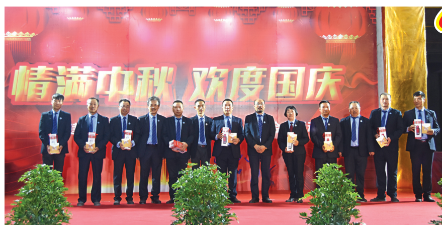
活动现场为当月过生日员工庆生并发放生日礼物

十堰蓝天建筑工程有限公司主办 2020年12月31日 星期四 第4期 (总第30期) 内部资料 免费赠阅